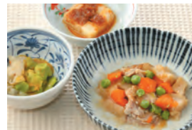
商品番号: 210506 肉じゃが 713円(税込) 1食分●173g / 169kcal / 塩分 1.4g