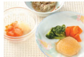
商品番号: 210512 和風おろしハンバーグ 713円(税込) 1食分●152g / 168kcal / 塩分 1.2g