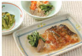
商品番号: 210526 さばの生姜煮 713円(税込) 1食分●162g / 207kcal / 塩分 1.5g