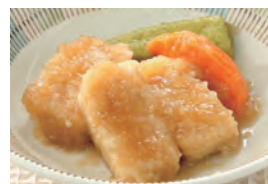
商品番号：211024 鶏肉と野菜の甘酢あん 391円(税込) 1食分●108g/188kcal/塩分1.1g