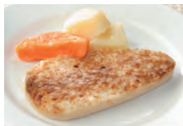
商品番号：211007 やわらかチキンソテー 391円(税込) 1食分●126g/146kcal/塩分1.3g