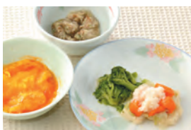
商品番号: 210516 鶏肉と野菜のクリーム煮 713円(税込) 1食分●165g / 171kcal / 塩分 1.1g