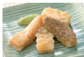
商品番号：211028 天ぷら盛り合わせ 391円(税込) 1食分●87g/204kcal/塩分1.0g