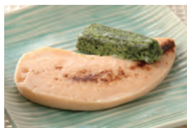
商品番号：211012 焼き塩鮭 391円(税込) 1食分●68g/99kcal/塩分0.8g