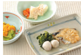
商品番号: 210513 たらもの西京焼き 713円(税込) 1食分●168g / 163kcal / 塩分 1.1g