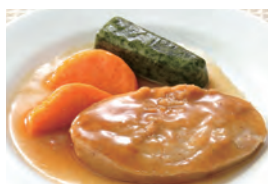
商品番号：211027 照焼きハンバーグ 391円(税込) 1食分●111g/179kcal/塩分1.5g