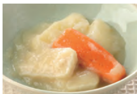
商品番号：211011 チキンシチュー 391円(税込) 1食分●117g/141kcal/塩分1.4g