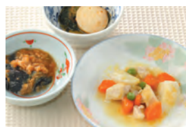
商品番号: 210524 鶏肉と野菜のカレーソース 713円(税込) 1食分●164g / 166kcal / 塩分 0.7g