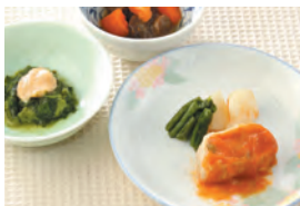
商品番号: 210507 ミートローフ 713円(税込) 1食分●161g / 144kcal / 塩分 1.0g