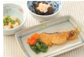
商品番号: 210527 メヌケのバター醤油風味 713円(税込) 1食分●169g / 180kcal / 塩分 1.2g