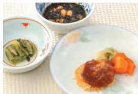
商品番号: 210528 味噌カツ 713円(税込) 1食分●142g / 163kcal / 塩分 1.6g