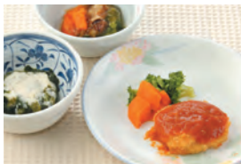
商品番号: 210503 とんかつ 713円(税込) 1食分●158g / 154kcal / 塩分 0.7g