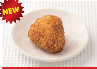
商品番号：220079 焼きおにぎり 70g × 10個 918円 (税込) 1個 ● 70g / 115kcal / 塩分 0.6g