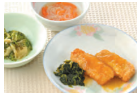
商品番号: 210509 鮭のカツツカレーソース 713円(税込) 1食分●185g / 196kcal / 塩分 1.3g