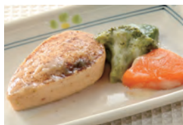
商品番号：211017 鮭のチャンチャン焼き風 391円(税込) 1食分●100g/117kcal/塩分1.1g