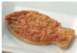
商品番号：211002 サバの照焼き 391円(税込) 1食分●67g/128kcal/塩分1.1g