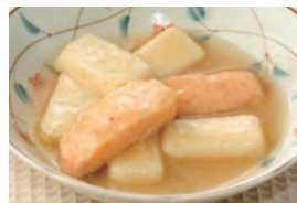
商品番号：211008 海老と豆腐の中華風炒め 391円(税込) 1食分●117g/118kcal/塩分1.2g