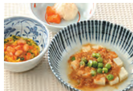
商品番号: 210510 麻婆豆腐 713円(税込) 1食分●168g / 138kcal / 塩分 0.8g