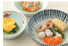
商品番号: 210504 厚揚げと鶏肉のお煮しめ 713円(税込) 1食分●172g / 142kcal / 塩分 1.3g