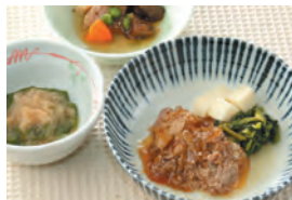
商品番号: 210523 すき焼き 713円(税込) 1食分●163g / 153kcal / 塩分 1.2g