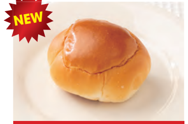
商品番号：220082 特小ロール 5個入り 316円 (税込) 1個 ● 115g / 377kcal / 塩分 1.3g