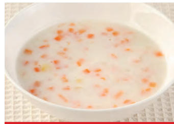
商品番号：220032 具たくさんスープ(クリーム) 162円 (税込) 1食 ● 180g / 52kcal / 塩分 0.9g