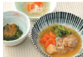
商品番号: 210525 八宝菜 713円(税込) 1食分●162g / 129kcal / 塩分 1.5g