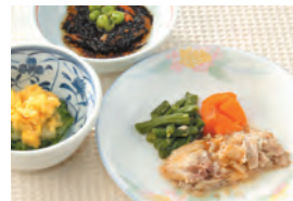
商品番号: 210514 豚肉の生姜焼き 713円(税込) 1食分●157g / 158kcal / 塩分 1.4g