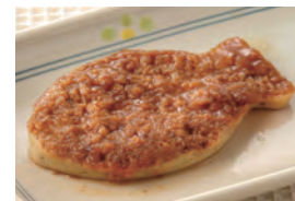
商品番号：211010 白身魚の生姜煮 391円(税込) 1食分●116g/142kcal/塩分0.9g