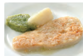
商品番号：211025 チキンフライ野菜添え 391円(税込) 1食分●99g/204kcal/塩分1.0g