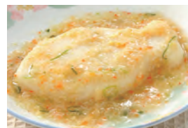
商品番号：211019 カレーの中華あんかけ 391円(税込) 1食分●99g/112kcal/塩分0.9g