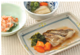
商品番号: 210520 カレイの煮付け 713円(税込) 1食分●159g / 167kcal / 塩分 1.8g