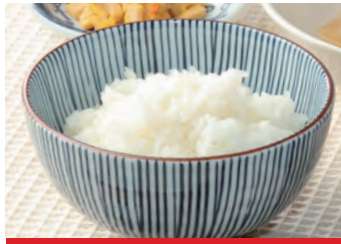
商品番号：220035 冷凍ご飯 (200g) 164円 (税込) 1食 ● 200g / 324kcal / 塩分 0.2g

用途に合わせてご飯、パン、 スープなどもご用意しております ●冷凍でお届け致します。