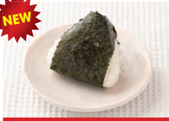
商品番号：220078 鮭おにぎり 100g × 10個 1274円 (税込) 1個 ● 100g / 167kcal / 塩分 0.8g