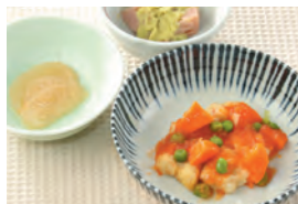
商品番号: 210511 酢豚 713円(税込) 1食分●146g / 183kcal / 塩分 2.1g