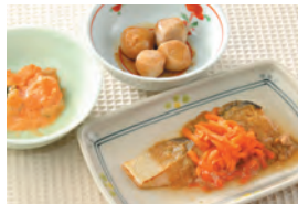
商品番号: 210515 鮭のチャンチャン焼き風 713円(税込) 1食分●170g / 176kcal / 塩分 1.7g