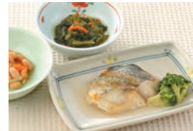
商品番号: 210502 さわらのおろし煮 713円(税込) 1食分●170g / 179kcal / 塩分 1.4g