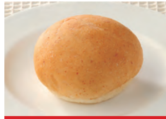
商品番号：220004 胚芽ロール 10個入り 359円 (税込) 1個 ● 30g / 85kcal / 塩分 0.3g