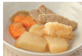
商品番号：211009 肉じゃが 391円(税込) 1食分●124g/165kcal/塩分0.8g