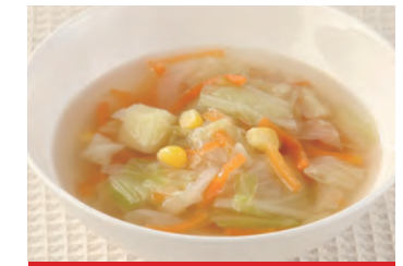
商品番号：220031 具たくさんスープ(コンソメ) 162円 (税込) 1食 ● 180g / 38kcal / 塩分 0.8g