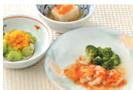
商品番号: 210521 チキントマト煮 713円(税込) 1食分●157g / 137kcal / 塩分 1.4g