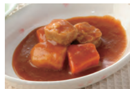
商品番号：211014 ビーフシチュー 391円(税込) 1食分●120g/150kcal/塩分1.0g