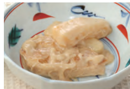
商品番号：211003 鶏肉の利久風煮 391円(税込) 1食分●116g/150kcal/塩分0.8g