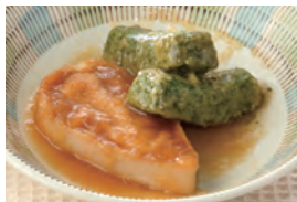
商品番号：211001 鶏の黒酢あん 391円(税込) 1食分●121g/137kcal/塩分1.1g