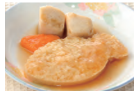
商品番号：211004 カレーの煮付け 391円(税込) 1食分●118g/160kcal/塩分1.1g