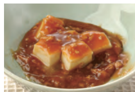
商品番号：211013 豚肉と豆腐の四川風 391円(税込) 1食分●115g/113kcal/塩分1.2g