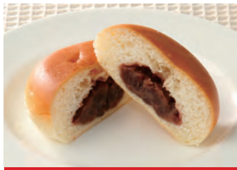
商品番号：220006 あんぱん 10個入り 418円 (税込) 1個 ● 30g / 92kcal / 塩分 0.1g