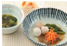
商品番号: 210501 牛肉のオイスター炒め 713円(税込) 1食分●160g / 144kcal / 塩分 1.2g