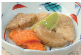
商品番号：211006 筑前煮 391円(税込) 1食分●98g/141kcal/塩分1.1g