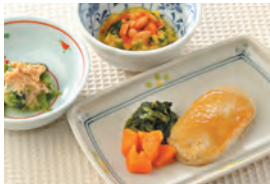
商品番号: 210518 いわしのつみれ焼き 713円(税込) 1食分●160g / 129kcal / 塩分 0.9g