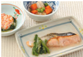
商品番号: 210505 鮭の塩焼き 713円(税込) 1食分●173g / 150kcal / 塩分 1.4g