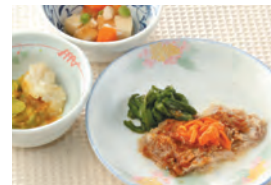
商品番号: 210517 豚肉の味噌和え(回鍋肉風) 713円(税込) 1食分●150g / 134kcal / 塩分 1.0g