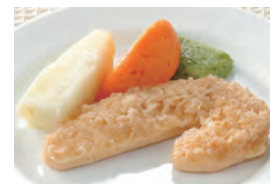
商品番号：211015 海老フライ 391円(税込) 1食分●106g/196kcal/塩分0.6g