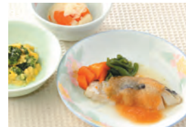
商品番号: 210522 たらものムニエル 713円(税込) 1食分●173g / 177kcal / 塩分 1.6g