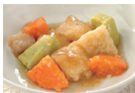
商品番号：211022 酢豚 391円(税込) 1食分●106g/211kcal/塩分1.1g