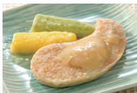
商品番号：211016 たらと野菜のバター焼き 391円(税込) 1食分●85g/123kcal/塩分0.9g