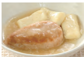
商品番号：211021 豚肉豆腐 391円(税込) 1食分●110g/131kcal/塩分0.8g