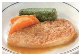
商品番号：211023 豚の生姜焼き 391円(税込) 1食分●107g/222kcal/塩分1.5g