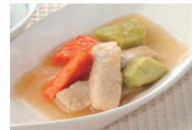
商品番号：211005 牛肉とビーマンのオイスターソース 391円(税込) 1食分●81g/142kcal/塩分0.9g