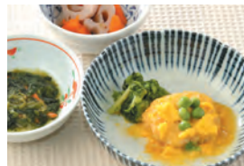
商品番号: 210519 カツ煮 713円(税込) 1食分●158g / 153kcal / 塩分 1.1g