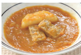
商品番号：211026 ビーフカレー 391円(税込) 1食分●120g/153kcal/塩分1.7g