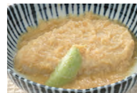
商品番号：211020 カツとじ 391円(税込) 1食分●109g/212kcal/塩分1.1g