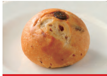
商品番号：220005 レーズンロール 10個入り 412円 (税込) 1個 ● 30g / 94kcal / 塩分 0.2g