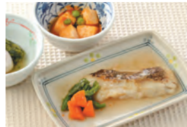
商品番号: 210508 メヌケの照り煮 713円(税込) 1食分●171g / 159kcal / 塩分 1.5g