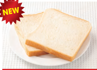
商品番号：220080 食パン8枚切り(2枚入り) 108円 (税込) 1枚 ● 85g / 229kcal / 塩分 0.9g