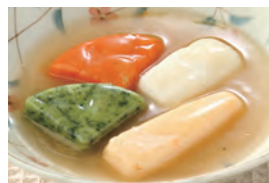
商品番号：211018 魚介の中華炒め風 391円(税込) 1食分●100g/80kcal/塩分1.2g