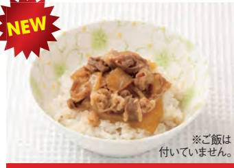
商品番号：220081 牛丼の具 215円 (税込) 1個 ● 90g / 188kcal / 塩分 1.4g